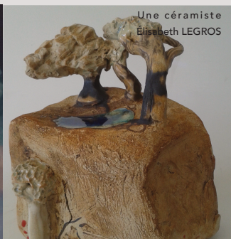
Une céramiste Élisabeth LEGROS