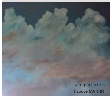
Un peintre Fabrice MARTIN