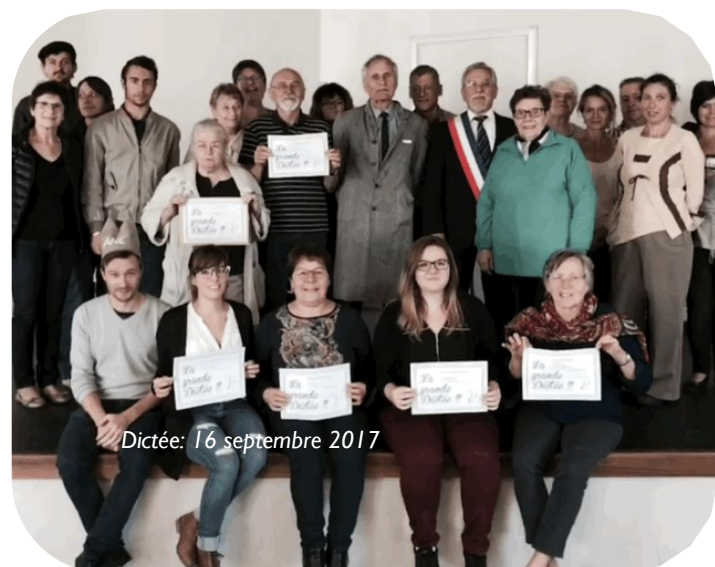
Dictée : 16 septembre 2017