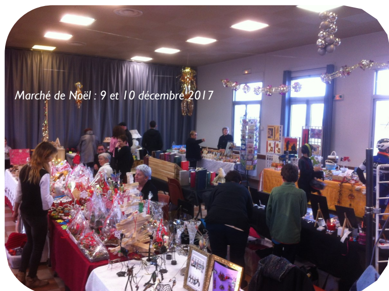
Marché de Noël : 9 et 10 décembre 2017