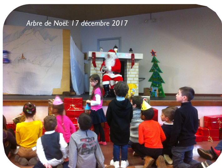
Arbre de Noël : 17 décembre 2017