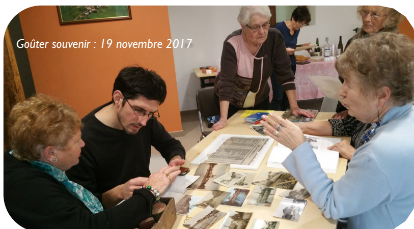
Goûter souvenir : 19 novembre 2017