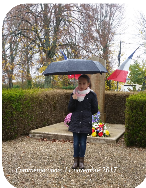
Commémoration : 11 novembre 2017