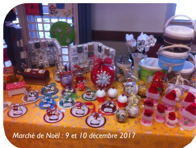
Marché de Noël : 9 et 10 décembre 2017